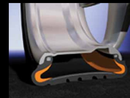
Llanta SSR después de perder aire: La llanta puede manejarse a una velocidad de 80 Km/hora a una distancia máxima de 80 Kms.