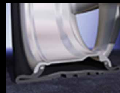
Llanta estándar después de perder aire: La llanta será destruida después de rotarla por un tiempo.